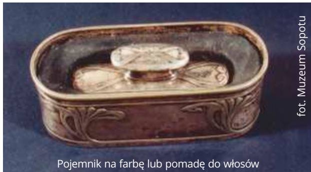
Pojemnik na farbę lub pomadę do włosów

W zbiorach sopockiego muzeum znajduje się szereg dodatków do ubiorów, przede wszystkim damskich. Obok torebek, rękawiczek, bucików czy wachlarzy w muzealnym magazynie jest także komplet damskich przyrządów kosmetycznych, datowany na ok. 1880-1900.