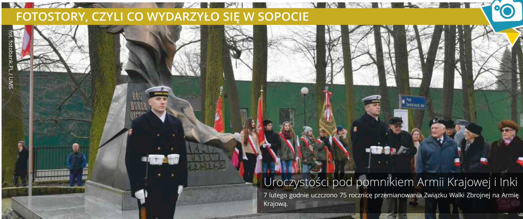
Uroczystości pod pomnikiem Armii Krajowej i Inki 7 lutego godnie uczczono 75 rocznicę przemianowania Związku Walki Zbrojnej na Armię Krajową.